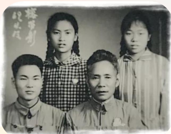
谷文昌与女儿、儿子合照

谷文昌作为一位县委书记，同时，他还是一位丈夫、一位父亲。他心中有戒，清白持家，简朴本分。当官者为子女留下什么？谷文昌的回答是一公私分明、简朴本分、为民奉献。