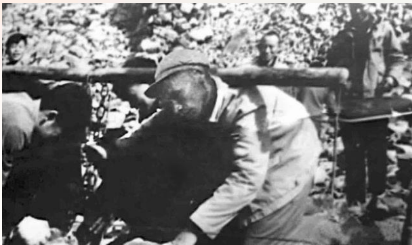
谷文昌在宁化兴建隆坡水库