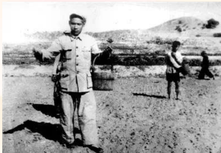
谷文昌在田间劳动